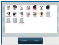
Resultados de la prueba