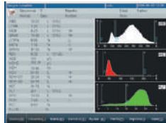
Ajuste de valores normales