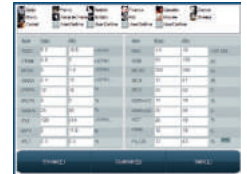
Selección del tipo de animal